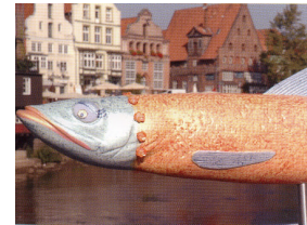
und überall in der Stadt: STINTE