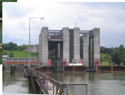
Abbildung 1 und 2