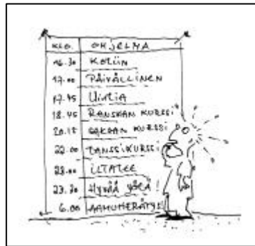
Lektion 1 • Seite 5

Nutzen Sie die alltäglichen Tätigkeiten zum Finnischlernen, indem Sie immer wieder auf Finnisch überlegen, was Sie wann machen wollen oder was für Termine Sie haben!