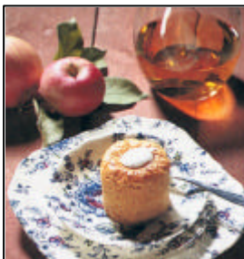
Die "Runeberg" -Törtchen

In einem gemütlichen Café im Zentrum, das bekannt war für seinen hervorragenden Kaffee, und beim Genuss eben dieses Runeberg-Törtchens, freuten wir uns über den schönen Tag in Porvoo und über das schöne Sonnenscheinwetter.