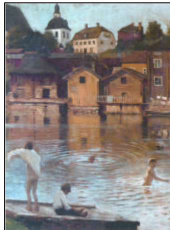
Albert Edelfelt: Porvoonjoessa uivia poikia (1886) (Badende Jungen im Porvoo-Fluss)