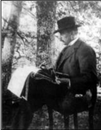
Albert Edelfelt (1854-1905) Finnlands international bedeutendster Künstler

Bei unserem Porvoo-Besuch waren die Jubiläen 200 Jahre Runeberg und 150 Jahre Edelfelt unsere eigentlichen Schwerpunkte, wobei Runeberg in diesem Bericht etwas ins Hintertreffen gerät, weil über ihn inzwischen schon so viel informiert wurde. Nicht nur in Porvoo, sondern auch hier bei uns in Hamburg.